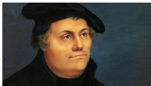
Martin Luther →