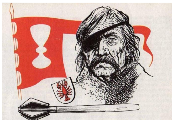
Podobizny Jana Žižky z Trocnova