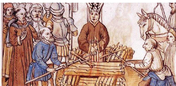
← Karikatura upálení Husa