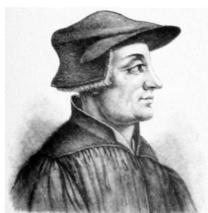
← Ulrich Zwingli

Ulrich Zwingli, křestní jméno později psáno též Huldrych, byl švýcarský humanistický teolog a první představitel švýcarské reformace. Položil základy pro vznik reformované církve. Zwingli se narodil 1. ledna 1484 ve Wildhausu (kanton St. Gallen). Studoval teologii v Bernu, ve Vídni a Basileji, poté působil jako farář, kazatel a též jako vojenský duchovní. V roce 1518 byl povolán do Curychu, kde se zasazuje pro reformaci. Marburské náboženské rozhovory s Lutherem v roce 1529, které měly vést k sjednocení stanoviska evangelíků, ztroskotaly na řešení otázky Svaté večeře Páně. Konflikt s katolickými kantony vyústil v roce 1528 ve válku. Zwingli umírá jako polní kněz v bitvě u Kappelu (kanton Curych) 11. října 1531.