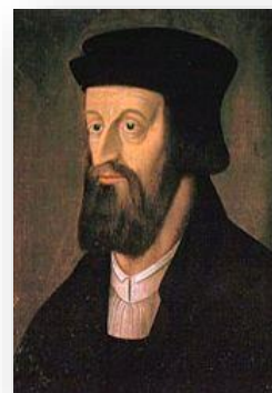
Podobizna Jana Husa →