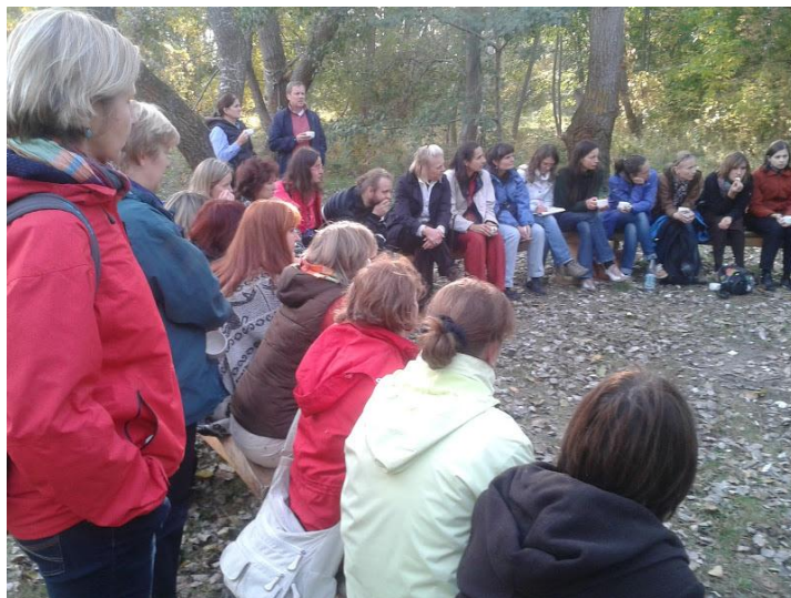
Diskutujeme a popijíme lahodný mátový čaj; mátu děti sami sami vypěstovali...

A to je hlavní cíl celého projektu. Nechat právě tyto děti, procházející pubertou, zaujaté samy sebou, prožít nutnost postarat se o sebe a druhé, dát jim možnost něco vytvořit podle jejich zájmu a schopností, práci dokončit a vidět a používat její výsledky, třeba i něco prodat – zažít prostě pocit sounáležitosti s druhými, smysluplnosti práce a jejích výsledků, a to ne jen náhodně během běžného vyučování ve škole, ale naplno, v místě, které je „jejich“, za které musí převzít odpovědnost. Bylo to úžasné vidět. Paní ředitelka není žádná teoretička a vizionářka. Všechno má pečlivě promyšlené a vyargumentované, většinu věcí vyzkoušených v praxi. Na všechny otázky fundovaně, a srozumitelně odpovídala a určitě nám všem dodala množství energie a nápadů do další práce ve školách i na vzniku 2. stupně Montessori v Kladně.